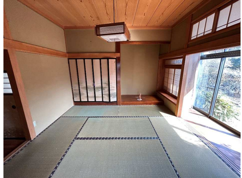
南東側和室 8 畳 (南側に面した廊下・縁側あり)