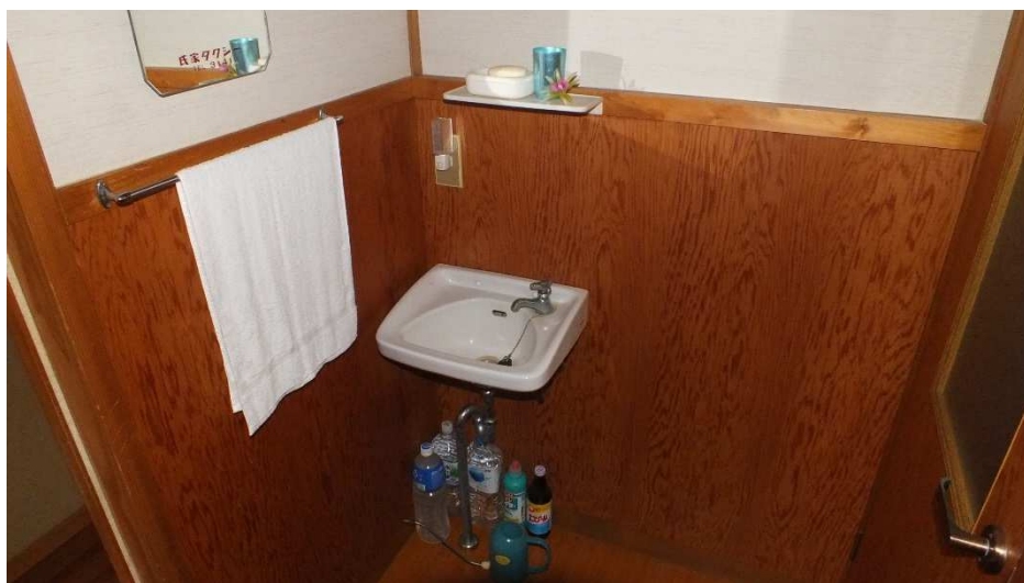
トイレ扉前手洗い場