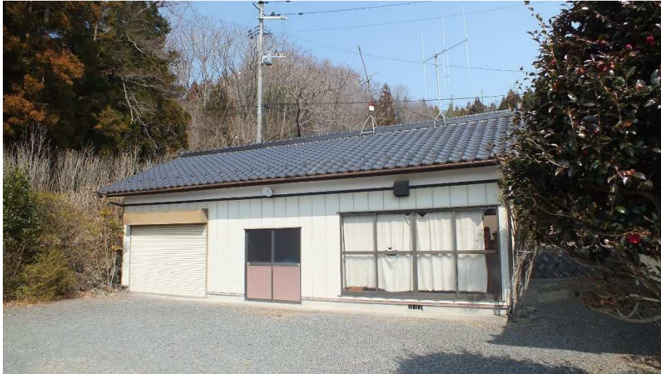
シャッター付きガレージ(1台分)/物置/離れの小部屋が一体になった納屋 1/2