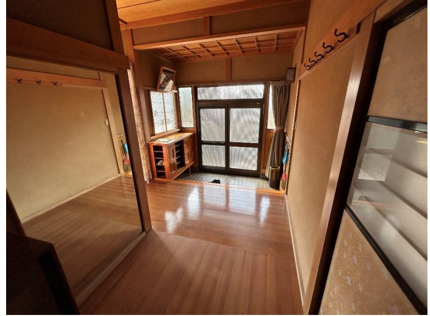
居間・和室 12畳 (掘りこたつ有)2/3