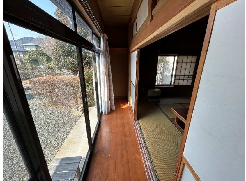
12畳居間・和室南側の縁側