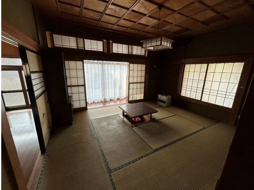
居間・和室 12畳 (掘りこたつ有)3/3