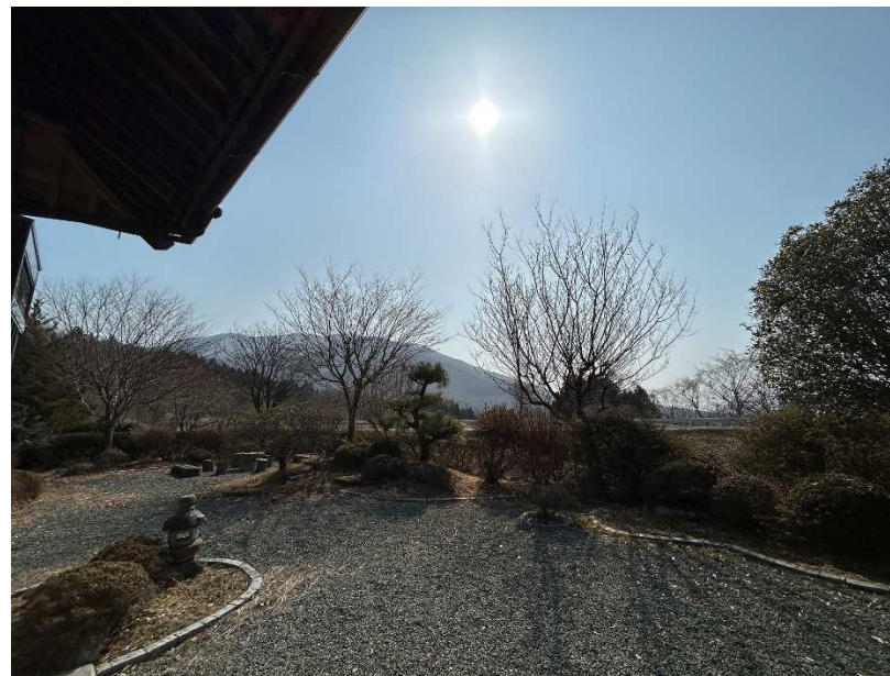
広い庭（今出山が良く見える） 2/4