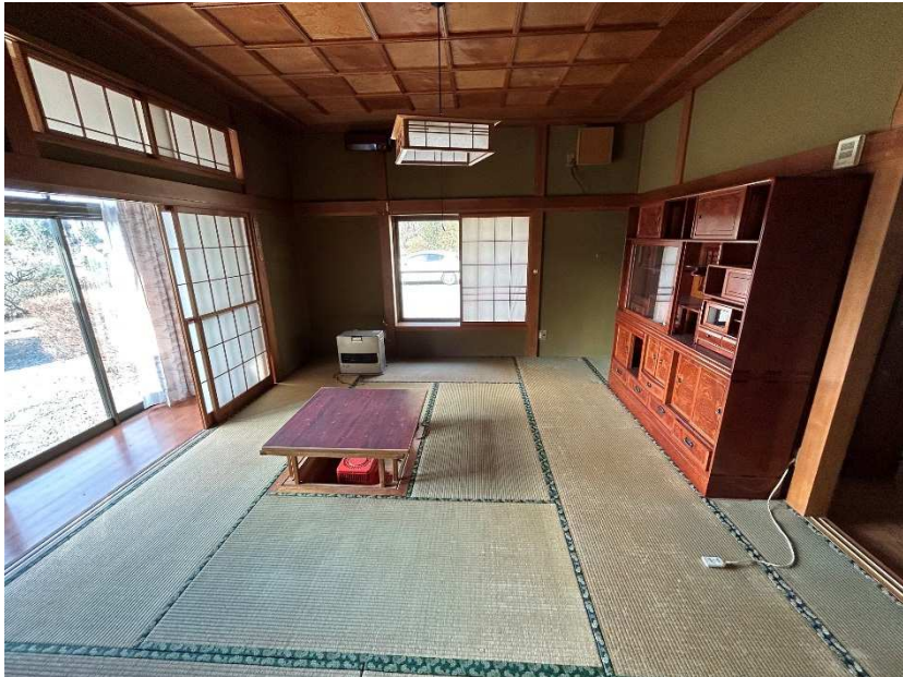
居間・和室 12畳 (掘りこたつ有)1/3