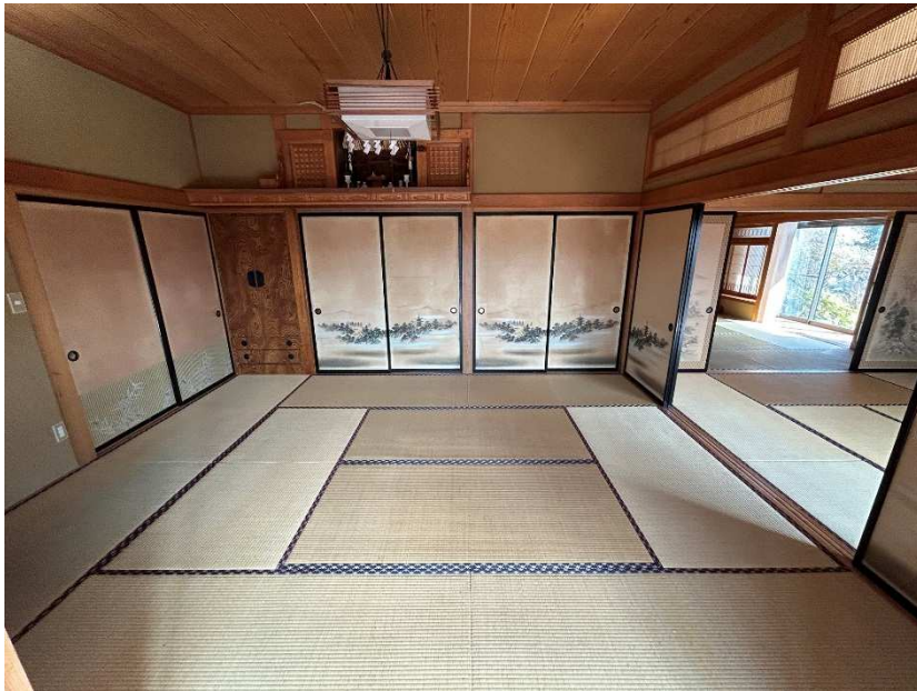
和室 10 畳 (神棚有)