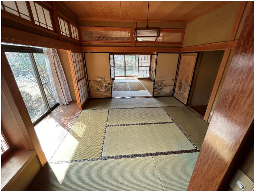
床の間から南東側和室への眺め 2/2