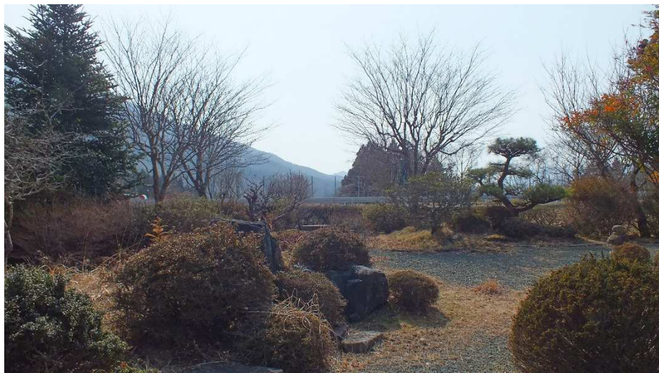
広い庭（今出山が良く見える） 1/4