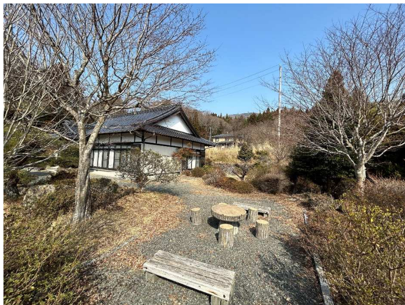
敷地内南東角にモルタルベンチ&テーブルのセット)3/4