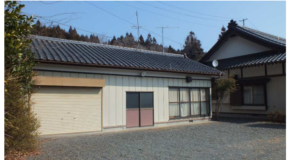
シャッター付きガレージ(1台分)/物置/離れの小部屋が一体になった納屋 2/2