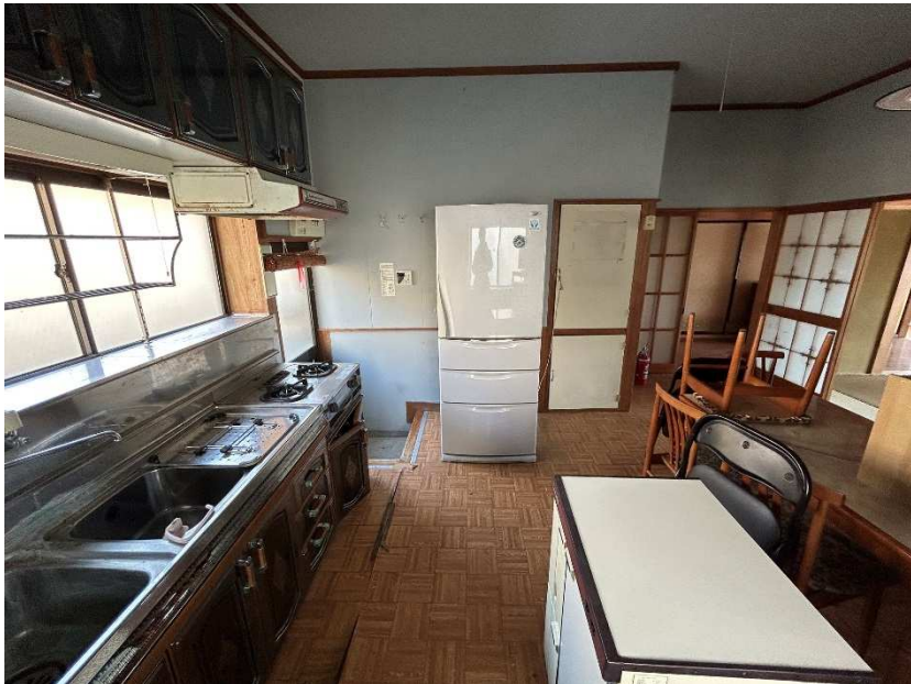
ダイニングキッチン 1/2